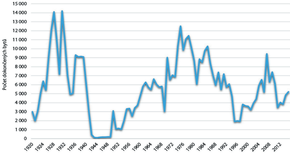
Obrázek 1.2: Vývoj ročního počtu dokončených bytů v Praze v letech 1920–2015

můžeme vzít vývoj bytové výstavby (viz obrázek 1.2), jako jednoho z nejdůležitějších faktorů sociálně-prostorové diferenciaci v Praze. Pokud zvolíme pro hodnocení pouze čísla od poloviny 90. let do současnosti, může se zdát celkový počet dokončených bytů mezi lety 2006–2009 jako mohutný. To už je ale méně zřejmé, pokud srovnáme velikost bytové výstavby v 70. a 80. letech. I tato čísla charakterizující bytovou výstavbu realizovanou především v panelových domech jsou ale relativně nízká ve srovnání s rozvojem v období první republiky, kde jsou data navíc zobrazena pouze za území tehdejší Velké Prahy. Tento jednoduchý příklad ukazuje na potřebnost dlouhodobější analýzy městského vývoje a ošidnost využití krátkodobých studií porovnávajících pouze socialistickou a postsocialistickou éru vývoje města.