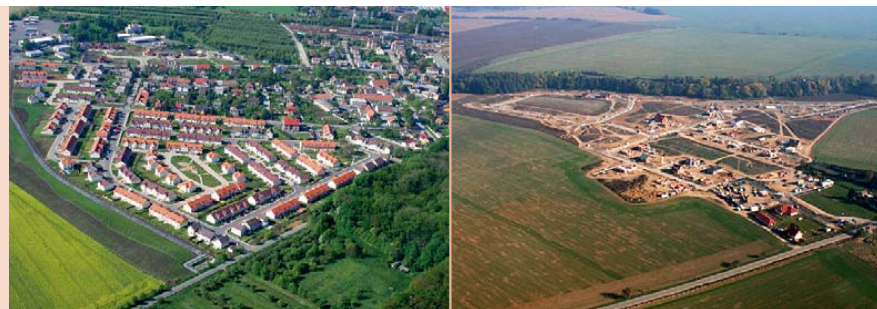
Odlíšná forma výstavby v Praze-Satalicích (vlevo) a v obci Zlatá (vpravo). Zatímco v Satalicích jsou dostupné veškeré služby a nová zastavba vhodně doplňuje původní sídlo, noví obyvatelé Zlatého bydlení nebudou mít k dispozici téměř žádnou sociální infrastrukturu ani služby.

obyvatelstva přicházejícího do zázemí města. Zlepšování obytného standardu a kvality života na sídlištích může tento odliv částečně zmírnit a udržet ve městě sociálně silnější a mladší obyvatelstvo.