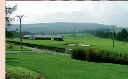
Nový suburbánní rozvoj má mnoho tváří. Na fotografiích jsou zachyceny některé z nich: řadové domky na okraji Kuřim v zázemí Brna, golfové hřiště v Dolanech u Olomouce, logistický areál v Modleticích u Prahy a obchodní centrum v pražských Štěrboholec.