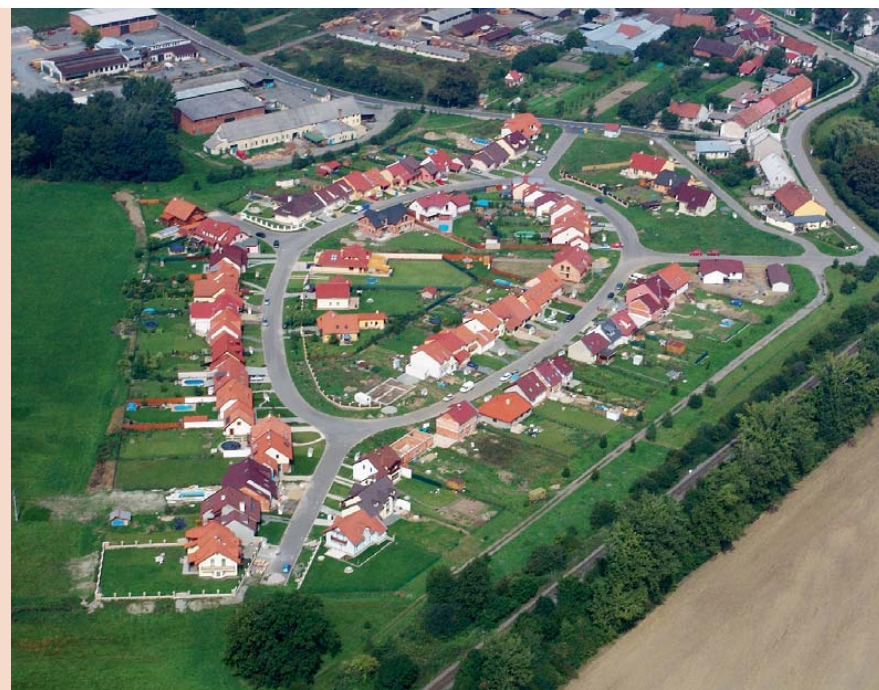
Počet obyvatel nových domů v obci Hlušovice severně od Olomouce převyšuje původní populaci. Zdroj: www.obechlusanne.cz.

ně udržitelnou formu prostorového růstu měst je obecně považován tzv. urban sprawl (☞ Urban sprawl ). Pouze zřídka můžeme v české krajině objevit zcela nová izolovaná sídla vzniklá suburbanizací na „zelené louce“. Tím se významně liší vývoj osídlení v České republice zejména od amerických měst, kde většina suburbánních sídel vznikla bez jakékoli návaznosti na starší osídlení.