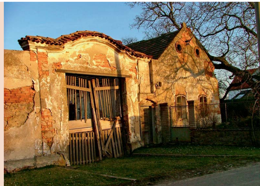
Nahore: Malá sídla byla systematicky likvidována v průběhu celého socialismu. Zastavení investic se promítlo do fyzického prostředí i do struktury obyvatelstva vesnic. Dole: Výstavba v druhé polovině dvacátého století znamenala vážný zásah do tváře vesnic.

PULDOVÁ, P., OUŘEDNÍČEK, M.: Změny sociálního prostředí v zázemí Prahy jako důsledek procesu suburbanizace.