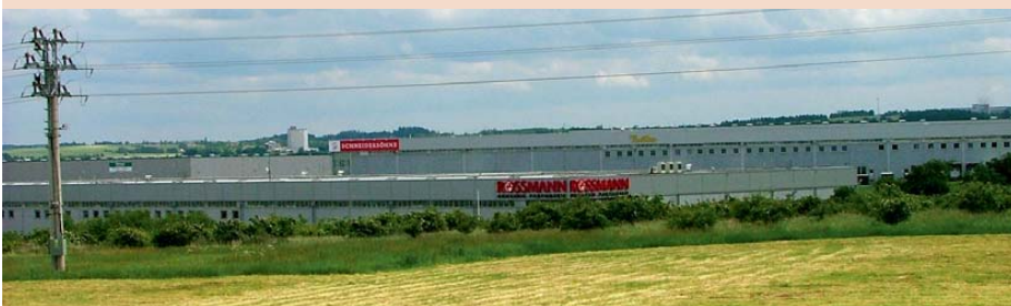
Neřízený suburbánní rozvoj lze v české krajině najít v nejrůznějších podobách. I když nepředstavuje nejvíce rozšířenou formu suburbanizace, je zdaleka největším ohrožením pro společnost i krajinu.