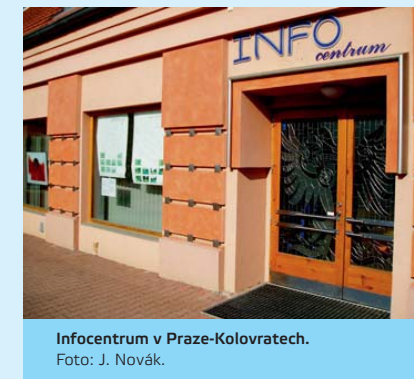
Infocentrum v Praze-Kolovratech.

✓ Příklad: Městská část Praha-Kolovraty zřídila v budově knihovny Infocentrum poskytující různé služby, například připojení na internet za zvýhodněnou cenu pro seniory. V obci Přešimasy slouží jako místo setkávání upravená zasedací místnost obecního úřadu, kterou pro své aktivity využívá kromě jiných také místní Klub žen nebo Mateřské centrum Šikulka. V obci Soběšice (okres Brno-venkov) si obyvatelé nové zástavby vybudovali místo setkání s ohništěm a barbecue.