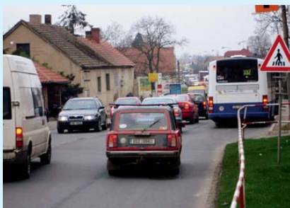
Jesenice u Prahy – hlavní silnice v největším českém satelitním městečku ráno ve všední den.

✓ Příklad: S cílem zlepšit dopravní obslužnost obcí na jih od Prahy, kde probíhá rozsáhlá rezidenční a komerční výstavba a území patří k dopravně nejvytíženějším sektorům Prahy, vznikl v roce 2004 Svazek obcí pro dopravu v pražském jižním regionu. Obce prosazují projekt MetroBusu, tedy vybudování samostatné pozemní komunikace pro rychlou autobusovou dopravu, která by spojila obce v jižním zázemí Prahy se stanicí metra na sídlišti Jižní Město.