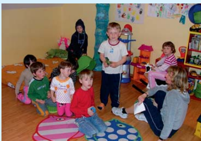
Prostory nově zařízeného Mateřského centra.

✓ Příklad: V obci Přišimasy (okres Kolín) se podařilo za pomoci aktivních nových spoluobčanů úspěšně předložit několik žádostí o státní dotaci a zajistit tak finance na obnovu veřejné zeleně a další rozvojové aktivity. Obec Hlincova Hora (okres České Budějovice) úspěšně využila specializovanou firmu například při žádosti o dotace na nákladný projekt kanalizace.