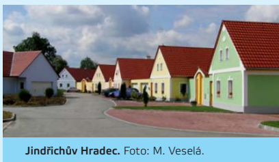
Jindřichův Hradec.

✓ Příklad: Na okraji Jindřichova Hradce lze najít jeden z mála příkladů nové zástavby, která respektuje charakter původní místní architektury a vhodně tak zapadá do lokálního prostředí. Podobného výsledku dosáhli i zastupitelé obce Hlušovice (okres Olomouc), kde celý okrsek nové výstavby byl naplánován a realizován na obecních pozemcích a pod přímým dohledem obce.