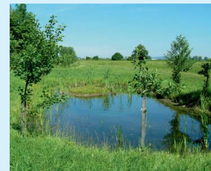
Příklad jednotky ÚSES. Zdroj: www.mze.cz.

✓ Příklad: O dotaci lze žádat z několika dotačních programů: MŽP ČR – Program péče o přírodní prostředí, Program péče o krajinu, Program revitalizace říčních systémů; MZE ČR- Horizontální plán rozvoje venkova; MMR ČR – Program obnovy venkova.