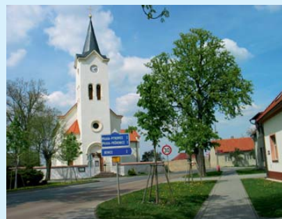
Revitalizované jádro obce Čestlice.

✓ Příklad: Obec Čestlice (okres Praha-východ) vlastnila pouze 3–4 % pozemků pro výstavbu komerční zóny. Přesto se jí díky připravenosti a silné vyjednávací pozici podařilo s developerem dohodnout financování obnovy obecní technické infrastruktury. Významné zlepšení technické infrastruktury v obci znamenala i dohoda zastupitelů městské části Praha-Šeberov s developerem, který hodlá v blízkosti dálnice D1 vybudovat obchodní zónu.