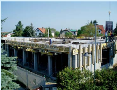
Nově budovaná základní škola v Praze-Kolovratech.

✓ Příklad: Městská část Praha-Kolovraty zpracovala ve spolupráci s Přírodovědeckou fakultou Univerzity Karlovy prognózu vývoje počtu a struktury obyvatel, na jejímž základě se rozhodovalo o vybudování nové základní školy.