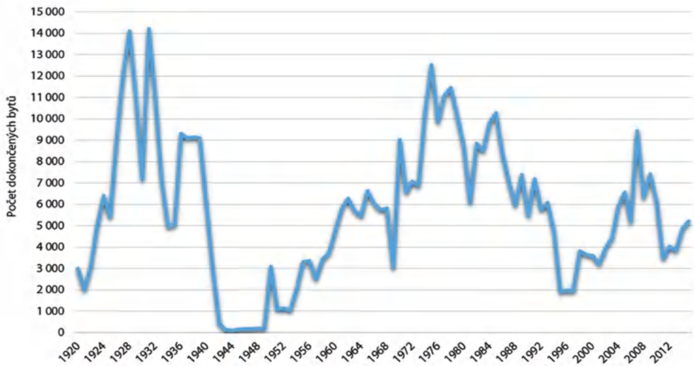
Obrázek 1.2: Vývoj ročního počtu dokončených bytů v Praze v letech 1920–2015

můžeme vzít vývoj bytové výstavby (viz obrázek 1.2), jako jednoho z nejdůležitějších faktorů sociálně prostorové diferenciaci v Praze. Pokud zvolíme pro hodnocení pouze čísla od poloviny 90. let do současnosti, může se zdát celkový počet dokončených bytů mezi lety 2006–2009 jako vysoce intenzivní. To už je ale méně zřejmé, pokud srovnáme velikost bytové výstavby v 70. a 80. letech. I tato čísla charakterizující bytovou výstavbu realizovanou především v panelových domech jsou ale relativně nízká ve srovnání s rozvojem v období první republiky, kde jsou data navíc zobrazena pouze za území tehdejší Velké Prahy. Tento jednoduchý příklad ukazuje na potřebnost dlouhodobější analýzy městského vývoje a ošidnost využití krátkodobých studií porovnávajících pouze socialistickou a postsocialistickou éru vývoje města.